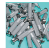
Piton escamotable Ø10 mm. WL1025