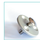
Piton terrasse bois. WL1026