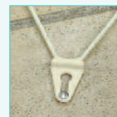
Nouveau système de fixation. Pratique, performant, sécurisant.