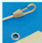
Assemblage pour soudure HF. Ourlet soudé.